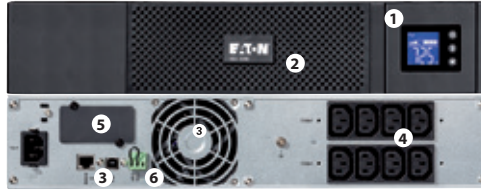
5SC 1500 Rack