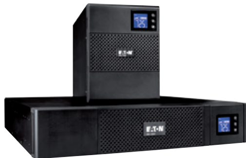
5SC поставляется в удобной компактной конфигурации