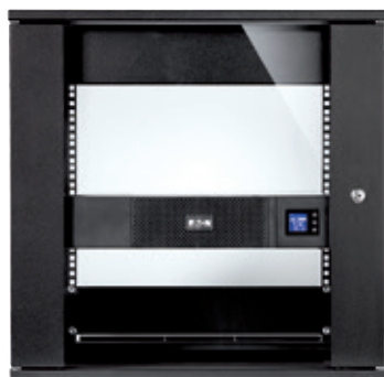
Формат небольшой глубины для установки в компактных стойках