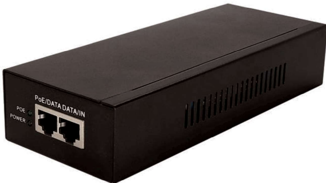
Рис.1 Midspan-1/902G, внешний вид