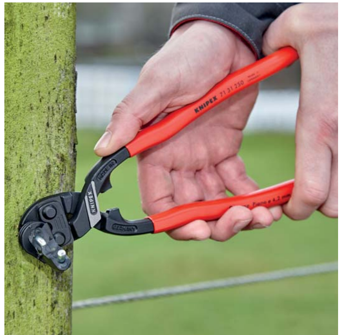
Работа двумя руками для достижения максимальной силы резания