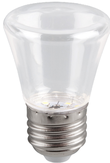
Арт. 25908, 25909