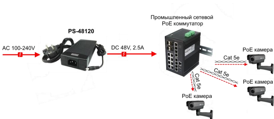
Рис.3 Типовая схема подключения блоков питания на примере PS-48120