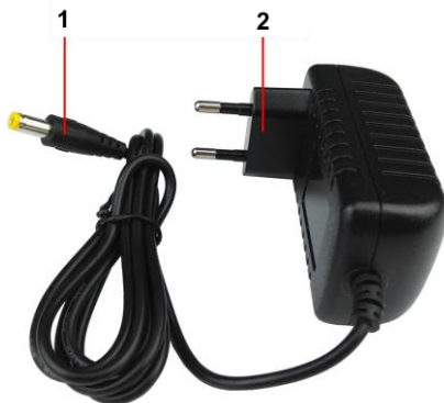
Рис. 1 Блок питания PS-48024, внешний вид, разъемы