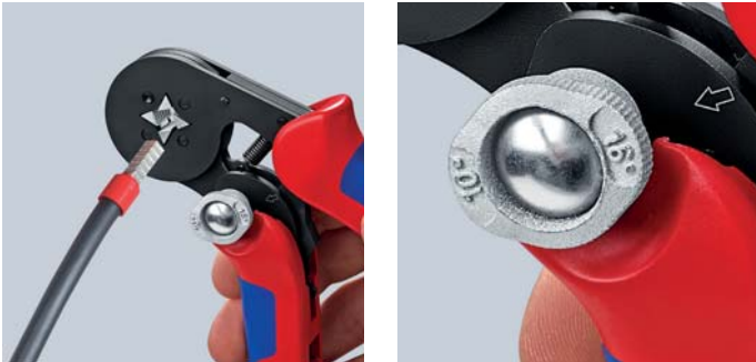
Переход параметра обжима с 10 мм 2 на 16 мм 2 происходит путем простого переключения

Квадратный обжим, теперь также для контактных гильз до 16 мм 2 Небольшая ширина раскрытия ручек