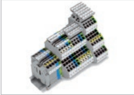
Комбинация многоуровневых клемм