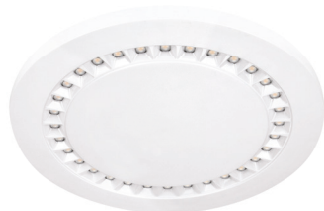
ДПО37-15-001 Punkt 840