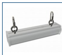
Кронштейн Diora Piton рым-болт (комплект)