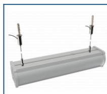
Кронштейн Piton тросовый подвес (комплект)