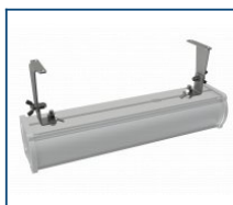
Кронштейн поворотный Piton (комплект)