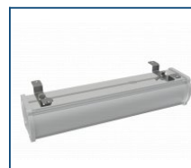
Скобы для накладного монтажа на стену Piton (комплект)