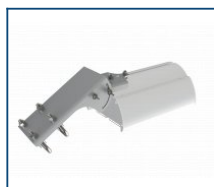
Кронштейн консоль поворотная Piton/Angar (комплект)