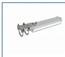
Кронштейн консольный Piton/Angar (комплект)