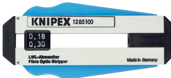
12 85 100 SB