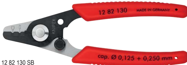
12 82 130 SB