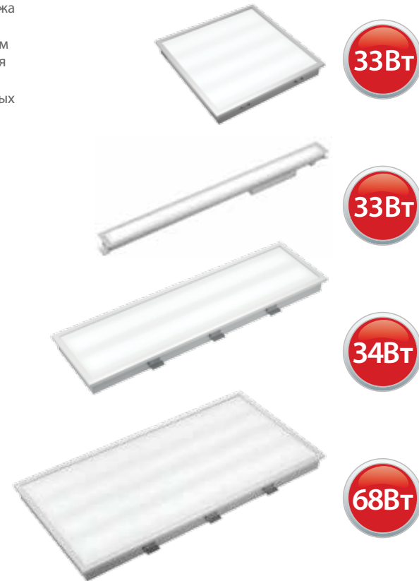
Комплект винтового крепежа