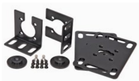
крепежный набор для вертикальных блоков