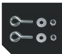
Комплект крепления на трос

Возможно изготовление светильника со встроенным датчиком движения.