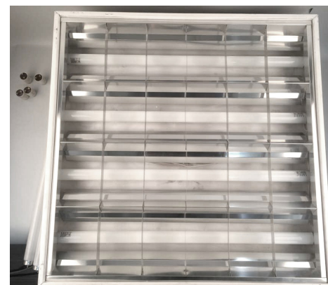
7. Устанавливаем отражатель. Светильник готов к эксплуатации!

Суммарная мощность не превышает 40 Вт. Суммарный световой поток 4х ламп SAFFIT в светильнике - 3000лм.