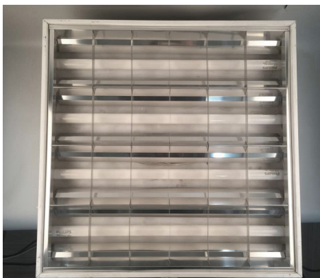
1. Берем классический потолочный светильник Армстронг с ЭмПРА и люминесцентными лампами.

Начать экономить никогда не было так просто!