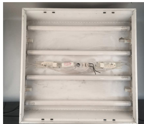
2. Снимаем отражатель.