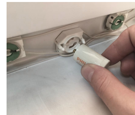
4. Для этого нужно, удерживая пускатель за корпус, повернуть его на 90° против часовой стрелки, после чего потянуть для извлечения из патрона. Повторить для всех установленных пускателей.