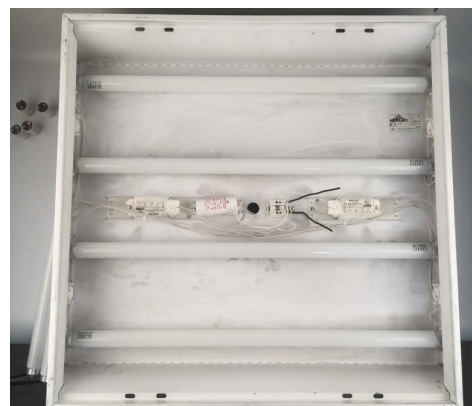
6. Устанавливаем светодиодные лампы SAFFIT.