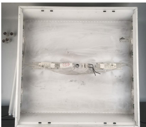
5. Вид светильника Армстронг, готового для установки светодиодных ламп SAFFIT.