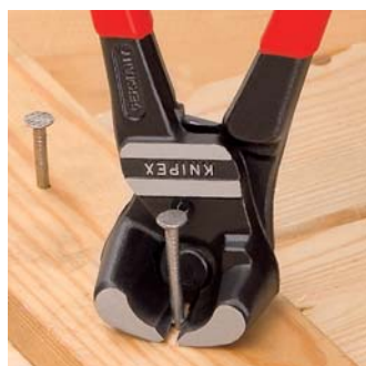
Обрезка винтов, гвоздей и т.д. почти заподлицо