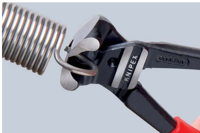
Высокая режущая способность: подходят даже для рояльной струны