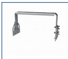
Кронштейн Лира Unit 60 (комплект)