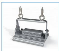
Крепление Рым-болт М6 Unit (комплект)