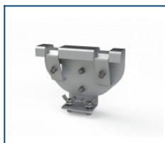
Кронштейн на трос Unit (комплект)