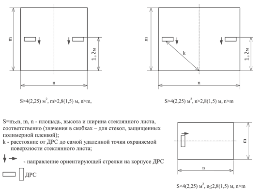
Рис. 2 – Варианты размещения ДРС