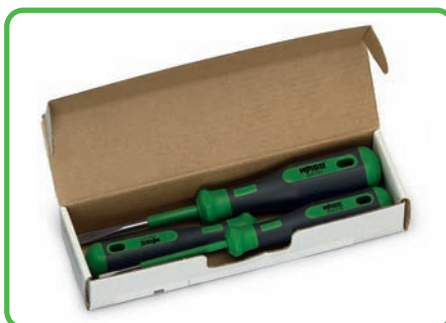
Комплект рабочего инструмента