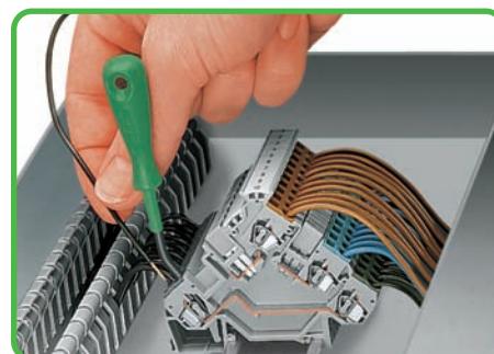
Размеры лезвия приведенных выше рабочих инструментов (DIN 5264) идеально подходят для простой работы с клеммами серии 280 с фронтальным входом для датчиков и приводных устройств.