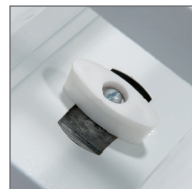
Узел крепления отражателя