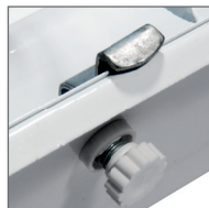
Крепление защитной решетки