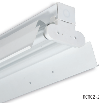
ЛСП02 - 2x58 - 001