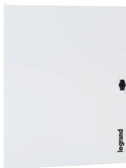
3 372 54