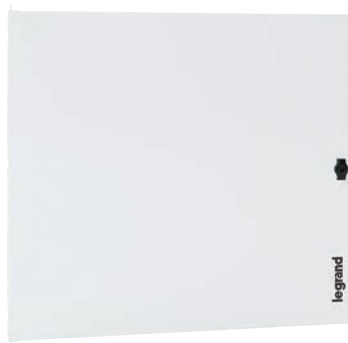
3 372 64