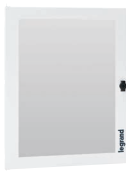
3 372 74