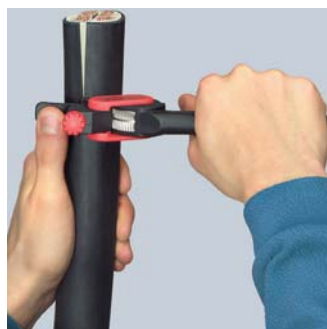
Вращение инструмента для разреза по окружности