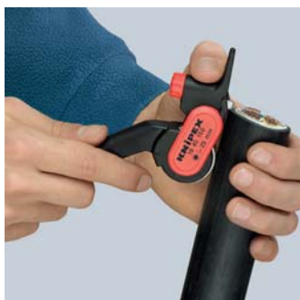
Установка инструмента для продольного реза