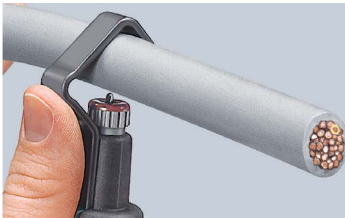
Установка инструмента для разреза по окружности