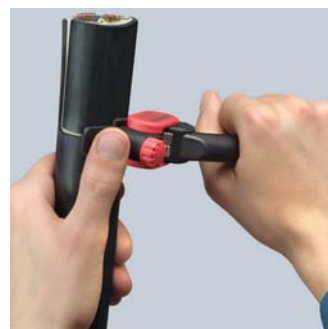
Рез по окружности