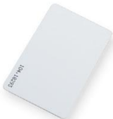
RFID Карта Mifare ISO 13.56MHz