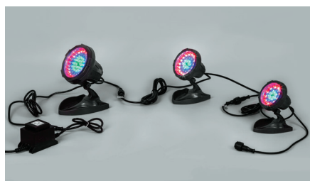
Соединение в линию