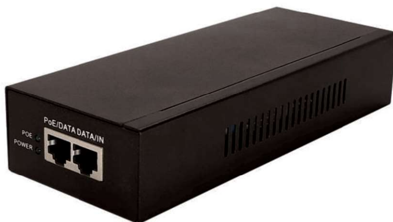
Рис.1 Midspan-1/652G, внешний вид