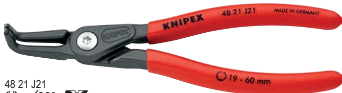
48 21 J21 90°