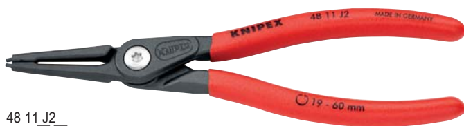
48 11 J2

Форма 2: DIN 5256 D; наконечники изогнуты под углом 90°