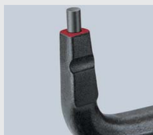
Прочные запрессованные концы из пружинной стали с высокой степенью сжатия

Для наконечников используется пружинная сталь высокой степени сжатия с поверхностью без бороздок. Таким образом, повышается динамическая и статическая нагрузка наконечников. При одномоментной перегрузке наконечники на 30% устойчивее по сравнению с обычными клещами, в то же самое время обеспечивая хорошую доступность при монтаже. При динамической нагрузке наконечники держатся до 10 раз дольше! Наконечники прецизионных клещей для стопорных колец закреплены методом холодного формования. Наконечники невозможно потерять!