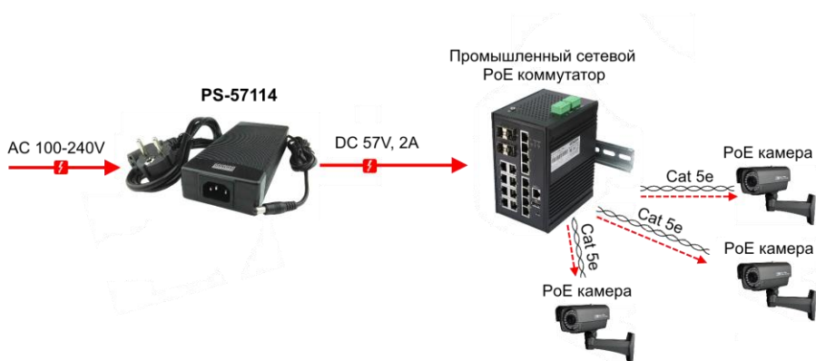
Рис.3 Типовая схема подключения блоков питания на примере PS-57114