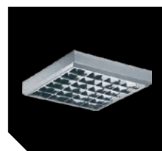
Цвет корпуса – металл