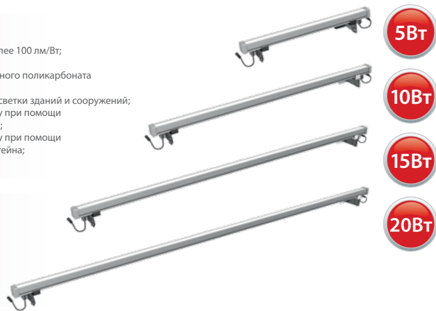
Модификация с прозрачным рассеивателем