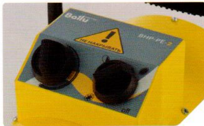
Встроенный термостат для поддержания заданной температуры