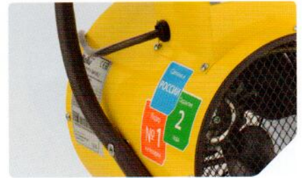
Антикоррозийная обработка и прочное полимерное покрытие корпуса