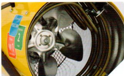
Надежные ТЭНы из нержавеющей стали и металлическая крыльчатка вентилятора

Компактные и легкие пушки в круглом корпусе с регулировкой угла наклона