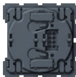
0 672 39