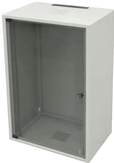
Шкаф SJ2 высотой 18 U со стеклянной дверью