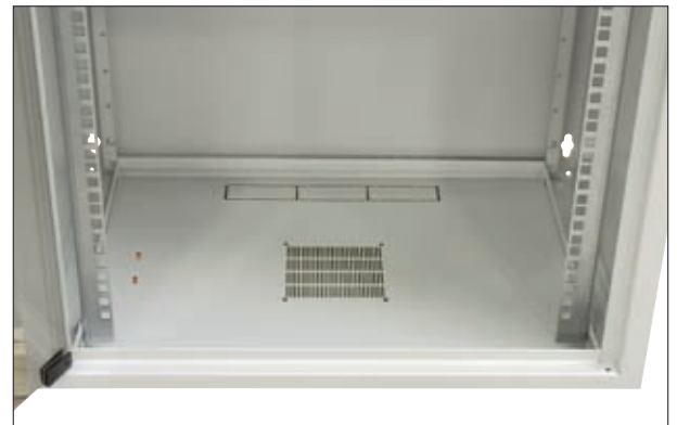
Нижняя плита шкафа SJ2