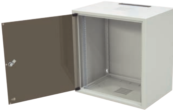
Шкаф SJ2 высотой 12 U со стеклянной дверью