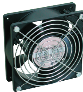
Вентиляционный комплект к шкафам SU, SD2, SJ2, SJB