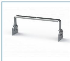
Кронштейн Лира Unit 90 (комплект)