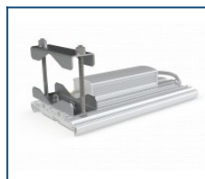
Регулируемый консольный кронштейн (до 82 мм)