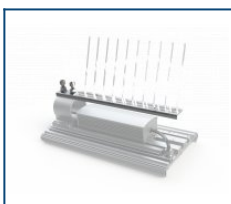
Отпугиватель для птиц Unit D90 (комплект)