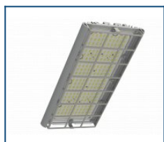
Решётка защитная Unit/Angar D90