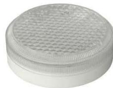
Исполнение 3, диаметр 180мм ЛУЧ-220-С 63, ЛУЧ-220-С 83, ЛУЧ-220-С 103 ~220В, 6/8/10Вт, 850/1050/1300Лм, 4000К (3000/5700К под заказ)