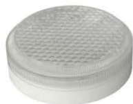
Исполнение 4, диаметр 150мм ЛУЧ-12-С 34/64, ЛУЧ-24-С 34/64, ЛУЧ-36-С 64, ЛУЧ-220-С 34/64, =12/=24/~36/~220В, 3/6Вт, 460/800Лм 4000К (3000/5700К под заказ)