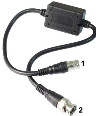
Рис. 2 Изоллятор I-НС, разъемы