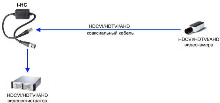
Рис.3 Типовая схема подключения изолятора I-НС через коаксиальный кабель