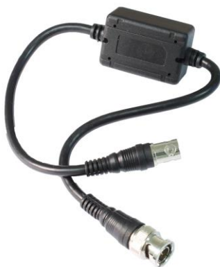
Рис.1 Изолятор I-НС, внешний вид